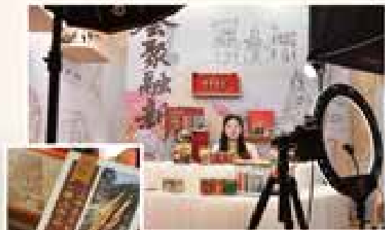
雷允上“上雷”本草滋补直播间 首发“一握人参茶”系列产品

从一握参的故事到一座城的香气，从本草滋补直播间的首秀到多款新品的首发亮相，这个拥有三百余年历史的老字号品牌正全力以赴打造着海派中医药文化的新范式，大胆探索健康生活的新理念，让好看、好喝、好玩的新中式养生态度走进千家万户，不断为健康消费提质增效。