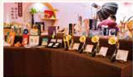
“允上生活”特别推出“海派文旅伴手礼专区”